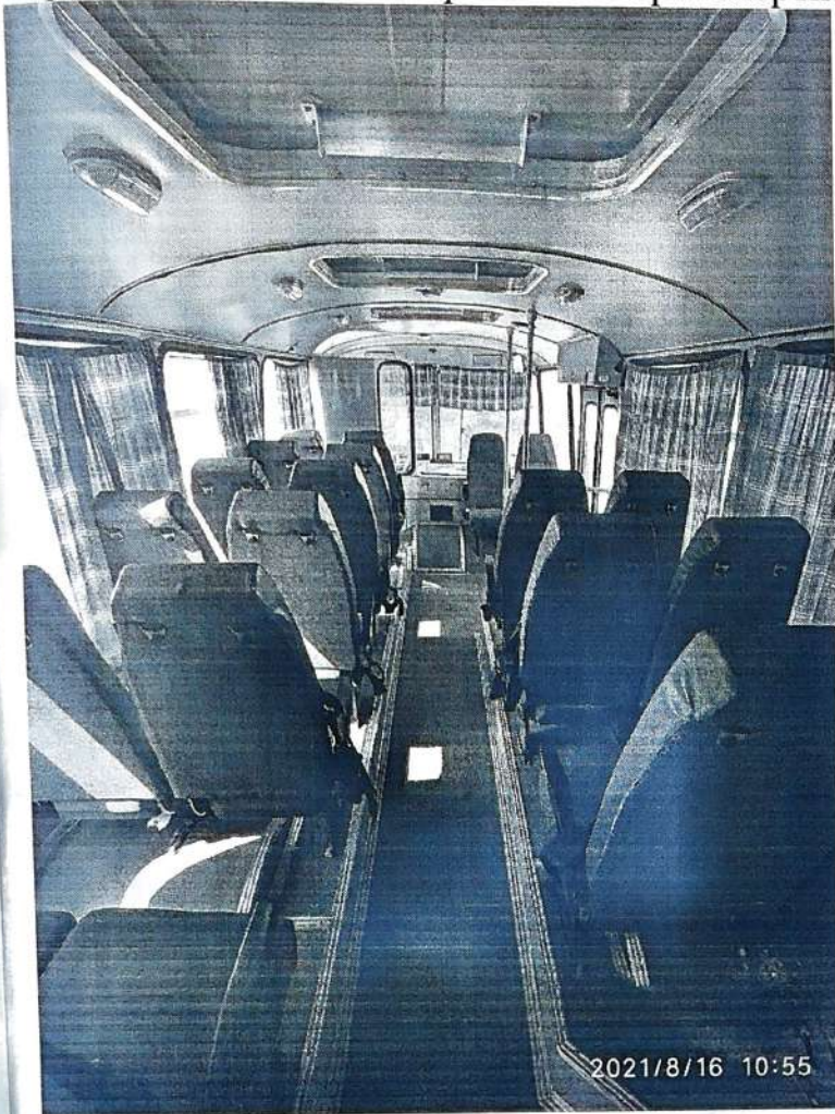
Образец вида специализированного транспортного средства